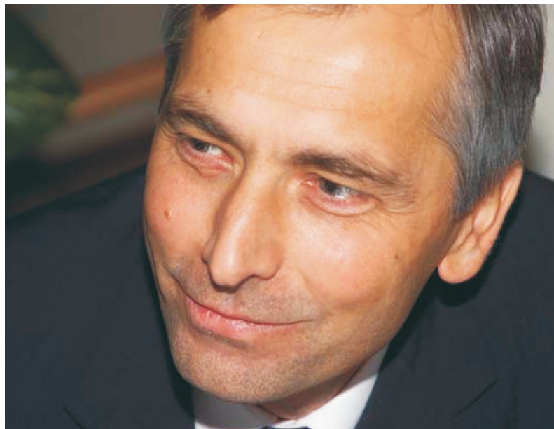
Ján Figel', Evropski komisar za izobraževanje, usposabljanje, kulturo in večjezičnost