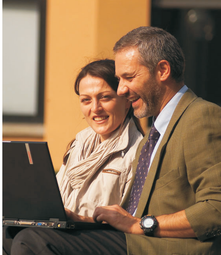
Μαθαίνουμε ο ένας από τον άλλο