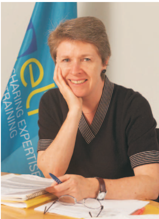
Muriel Dunbar, διευθύντρια του ETF

Έχοντας αναλάβει τα καθήκοντα του διευθυντή του Ευρωπαϊκού Ιδρύματος Επαγγελματικής Εκπαίδευσης (ETF) τον Ιούλιο, χαίρομαι ιδιαίτερα που μου προσφέρεται μια ευκαιρία ανασκόπησης του έργου του ιδρύματος για το έτος 2004. Αυτή η αναδρομή στο παρελθόν είναι ένα πολύτιμο εργαλείο που μπορεί να συμβάλει στον καθορισμό της μελλοντικής πορείας. Φυσικά, είναι περιττό να αναφέρω τη μεγάλη χρησιμότητά της για έναν νέο διευθυντή.