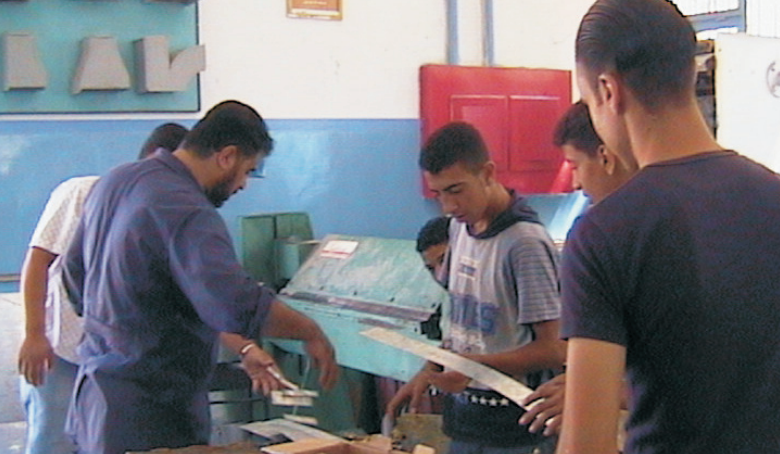
Το θέμα των παισίων επαγγελματικών προσόντων αποτελεί σημαντική πτυχή της μεταρρύθμισης της ΕΕΚ

Το ETF έχει πρωτοστατήσει στον τομέα αυτό σε ορισμένες από τις χώρες εταίρους του, με σημαντικότερη, ίσως, τη Ρωσική Ομοσπονδία. Στο πλαίσιο της παροχής γενικών συμβουλών πολιτικής στη ρωσική κυβέρνηση κατόπιν αιτήματός της, ξεκίνησε το 2003 η διοργάνωση συνόδων εργασίας σε θέματα που ανέκυψαν από τη διαδικασία της Κοπεγχάγης. Το 2004 η θεματολογία των συνόδων εργασίας επεκτάθηκε στα εθνικά πλαίσια επαγγελματικών προσόντων και στη συμβολή τους στη διά βίου μάθηση.