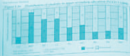
Figure 4.20 - Distribution of studies by gender (2002-2008)