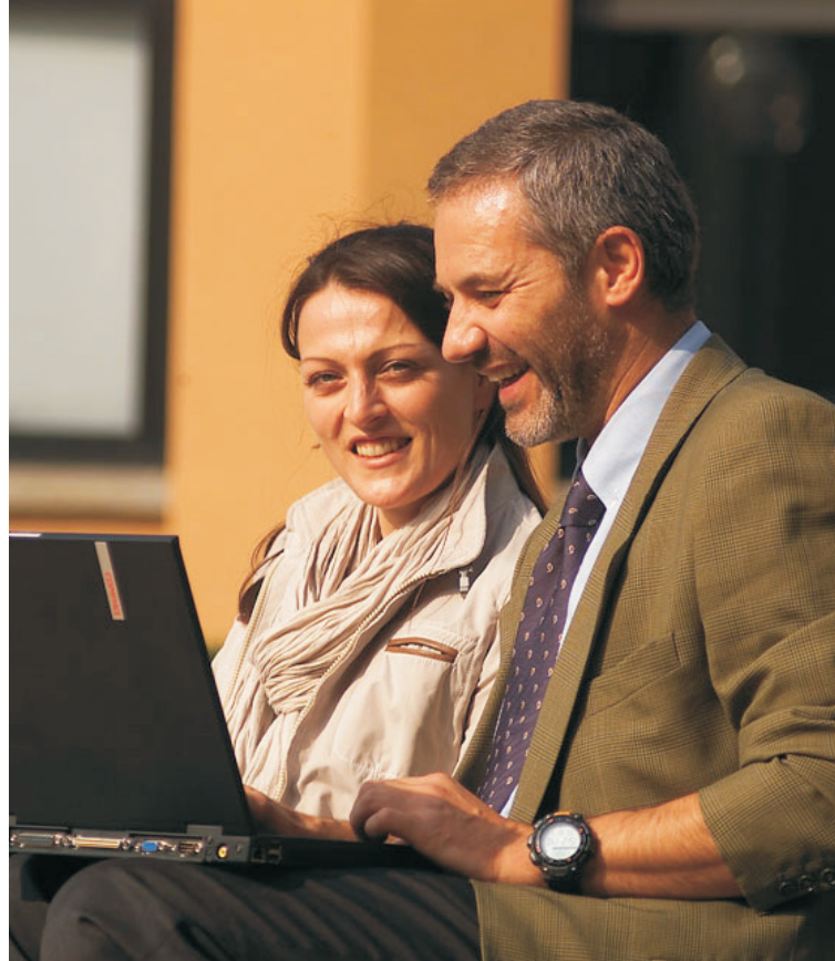
Oleme üksteisele õpetajad.