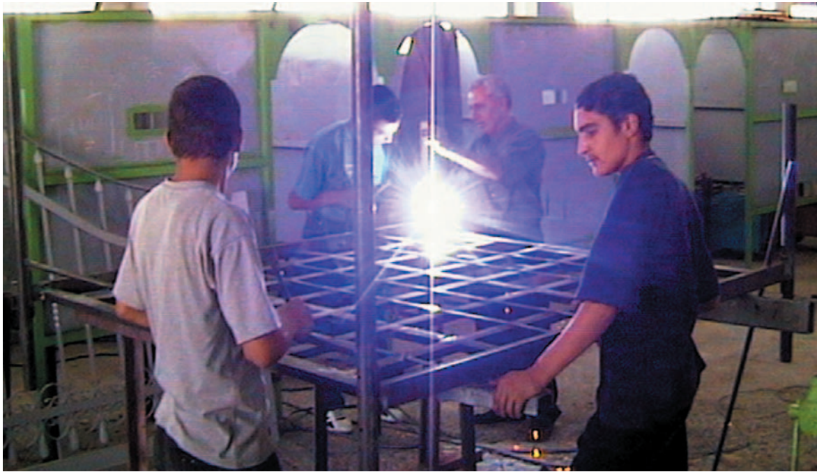
Abistamine töö leidmisel on üks viis vaesusega võitlemiseks kohalikul tasandil.