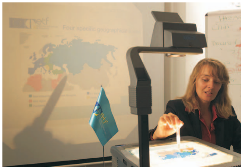
ETF projektide esmane eesmärk on inimressursside arendamine tulevastes EL liikmesriikides ja teistes partnerriikides.