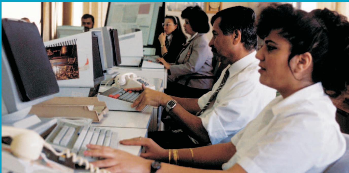
Hiljutised e-õppe algatused on suunatud eelkõige vanemale elanikkonnale.