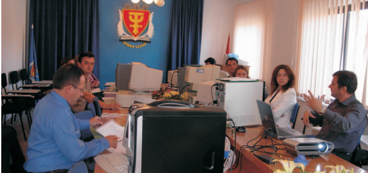
Albaania ja Kosovo kohaliku majanduse ja tööhõive arendamise (LEEDAK) projekt näitab, kuidas ühised kogemused ja eriteadmised võivad naabritele kasuks tulla.

lähedal, et seda tunda. Nemad teavad kõige paremini, mida kohalikud inimesed vajavad, kes võiksid neid küsimusi lahendada, kui palju tuleks õpetamis- ja koolitustavasid muuta jms.