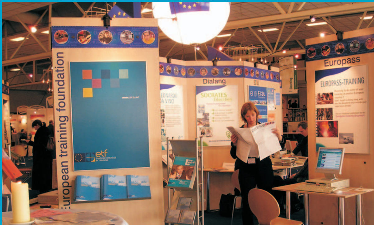
Märkimisväärse osa ETF tööst partnerriikidega moodustab teabe ja eriteadmiste jagamine.

Partnerlus kõigi kodanikuõppest huvitatute vahel tagas jätkuva pühendumise üritusele ka pärast projekti lõppu. Projektiga tutvustati Euroopa õpetajakoolituse võrgustikus (ETEN) osalevaid teaduskondi ja nende pühendumisest annab tunnistust ETEN-i 2005. aasta koosoleku ühine korraldamine.