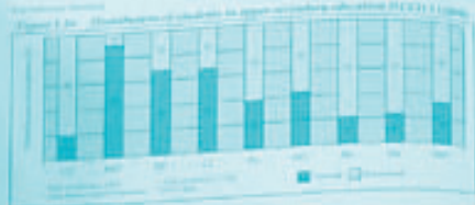
Figure 4.20 - Distribution of studies by country