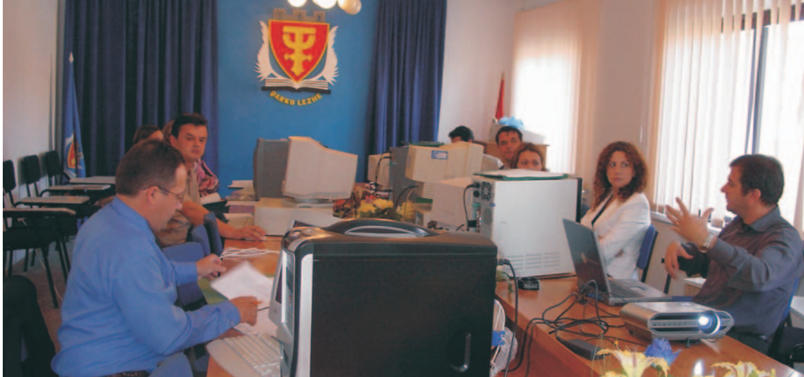
Projekt miestneho hospodárskeho rozvoja a rozvoja zamestnanosti v Albánsku a Kosove (LEEDAK) ukazuje, ako môžu susedia využiť spoločné poznatky a skúsenosti.

blízko, aby to cítili. Vedia najlepšie, čo potrebujú ľudia z ich obce, kto sa na nich môže obrátiť, do akej miery je možné prispôbiť vzdelávacej a vyučovacej praxe a pod.