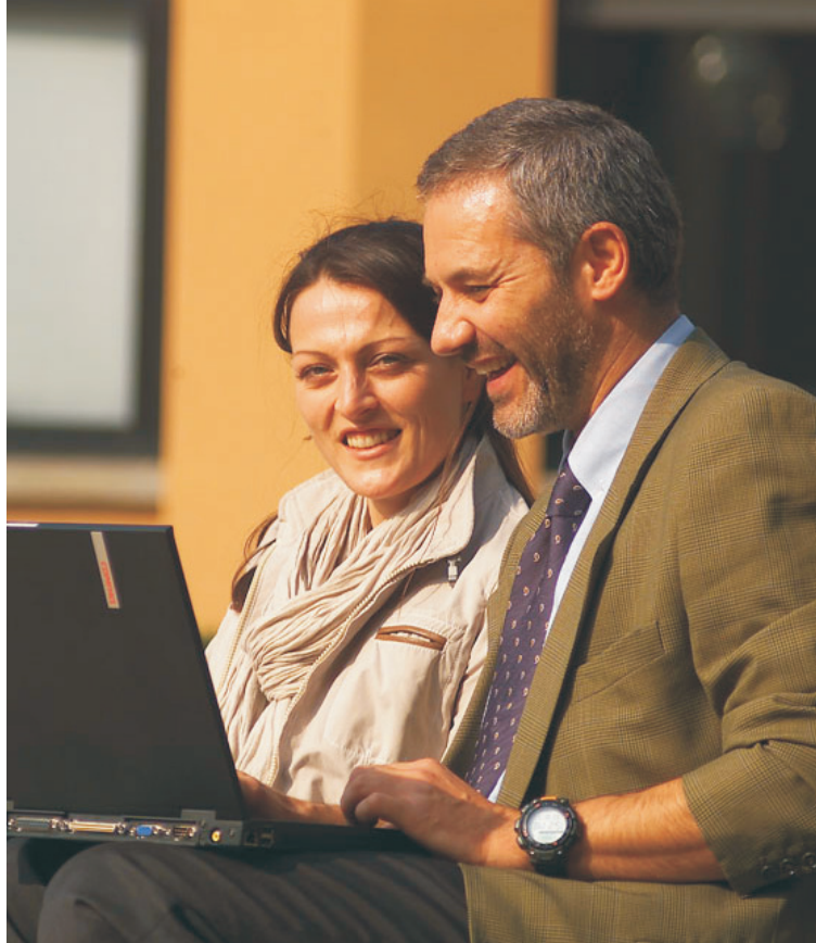
Sme si učiteľmi navzájom.