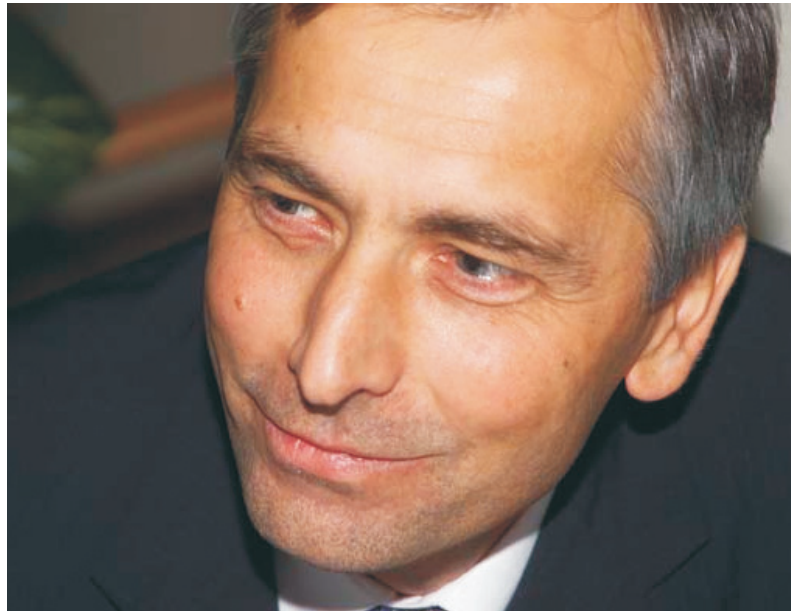
Ján Figel', komisár EÚ pre školstvo, odborné vzdelávanie, kultúru a viacjazyčnosť