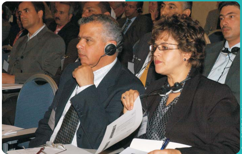
I partecipanti al progetto MEDA-ETE si incontrano a Roma per il forum annuale generale

Nel 2007, l'ETF ha condotto altresì analisi congiunte con le parti interessate in Albania, Kosovo e Turchia sulle sfide rappresentate dall'attuazione delle riforme delle scuole di formazione professionale. Tali analisi consistevano in esercizi di apprendimento fra pari effettuati attraverso una matrice di comprovata valenza. Le conclusioni hanno dimostrato chiaramente che i responsabili dell'istruzione, a tutti i livelli, possono svolgere un ruolo più efficace nel processo di riforma se sono consapevoli di come si sviluppano i cambiamenti e se sono sensibili alle opportunità e agli ostacoli che ne possono derivare.