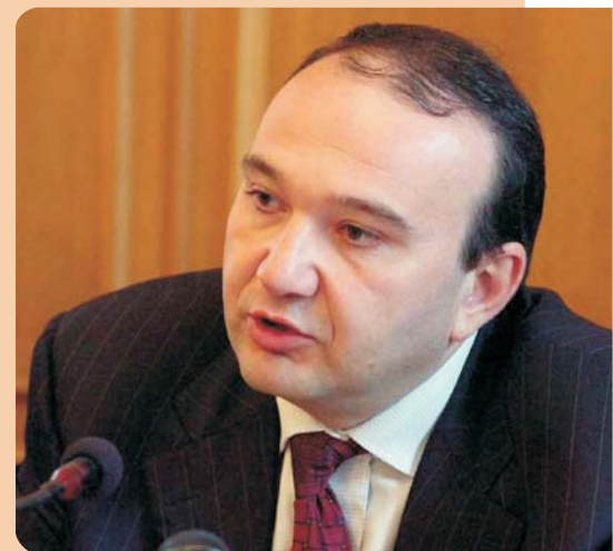
Levon Mkrtchyan, ministro armeno per l'istruzione e le scienze da maggio 2006 a giugno 2008

“Credo che tutto ciò svilupperà significativamente il sistema armeno di formazione professionale e contribuirà a fornire al mercato nazionale del lavoro manodopera specializzata in un periodo di tempo relativamente breve” ha detto il dottor Mkrtchyan.