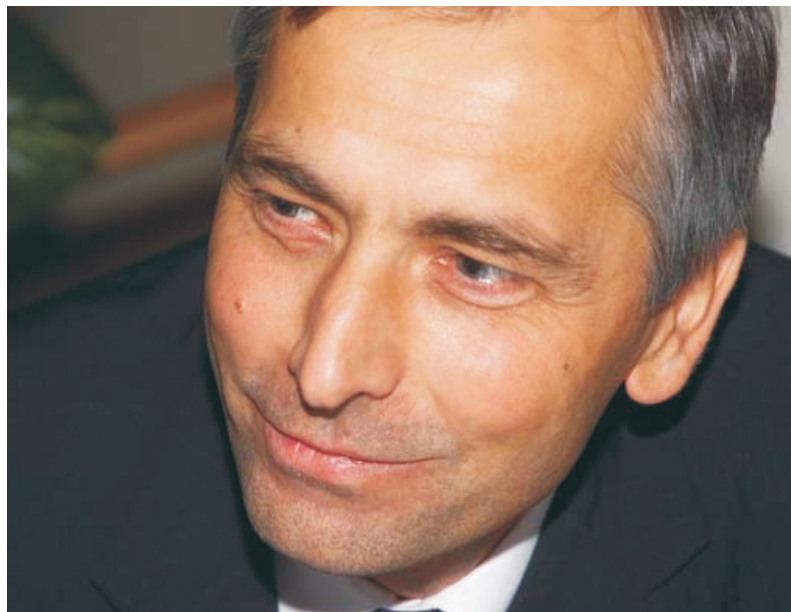
Ján Figel', koulutuksesta, kulttuurista ja monikielisydestä vastaava komission jäsen