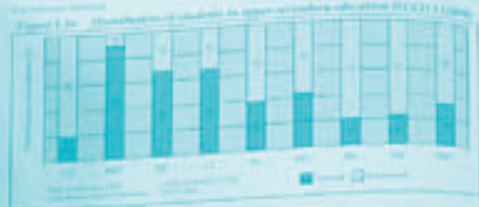
Figure 4.20: Distribution of studies by gender (2002-2010)