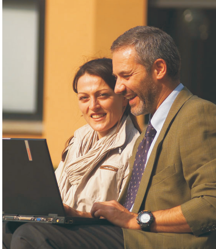
Olemme toinen toistemme opettajia.

Yhteistoimintakokouksessa pyrittiin alustavasti ratkaisemaan, miten opettajan ammattia voitaisiin ammatillisen koulutuksen sidosryhmien avulla nykyaikaistaa. Asiaan liittyvien kysymysten monimutkaisuus kävi selkeästi ilmi. Opettajien ja kouluttajien koulutus on keskeinen asia koulutuksen