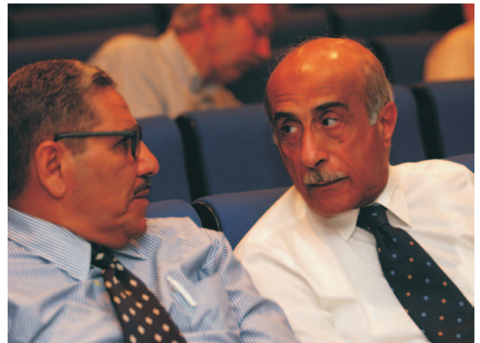
Kokemuksista voidaan oppia vain, jos vuoropuhelu on avointa.

Kuten kehystetty tekstiosuus, esimerkki Pietarista, osoittaa, arviointien tausta-ajatus – samassa asemassa olevilta oppiminen – on omaksuttu ja sitä on sovellettu onnistuneesti. Siitä on tullut Euroopan koulutussäätiön työssä suurelta osin toistuva tekijä.