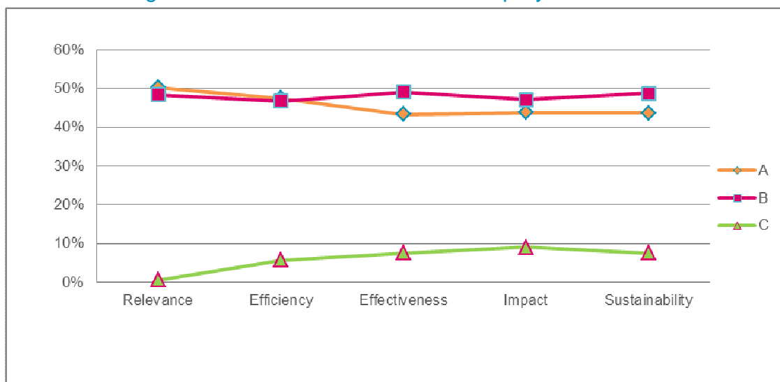
Gráfico 3: Visión general de las autoevaluaciones de proyectos en 2013