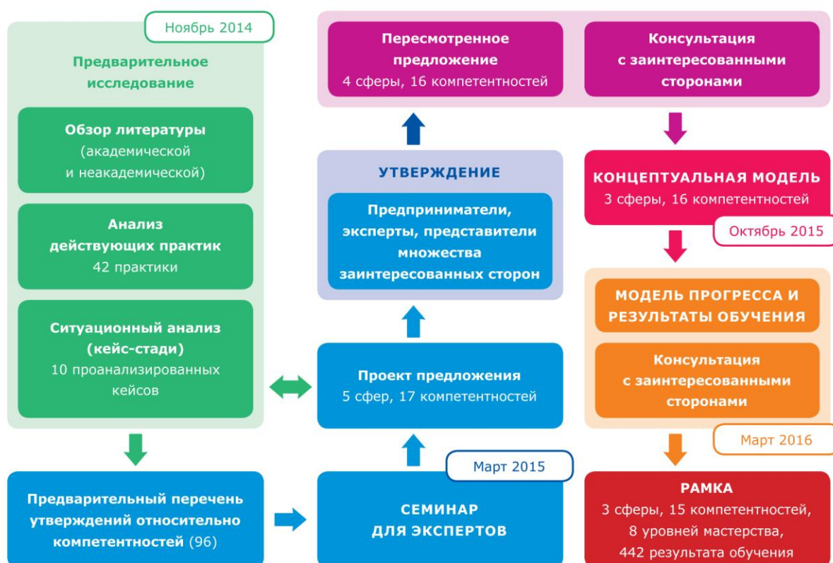
Рисунок 1: Основные этапы исследования, приведшие к созданию Рамки EntreComp

Этапы исследования EntreComp, которые помогли определить консолидированную рамку EntreComp, представлены ниже, на Рисунке 1: