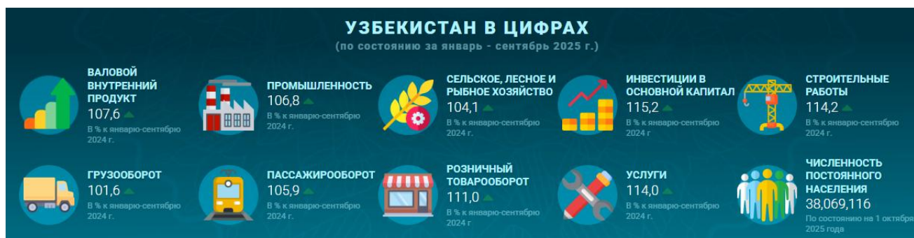
График 2. Узбекистан в цифрах (по состоянию за январь - сентябрь 2025 г.)