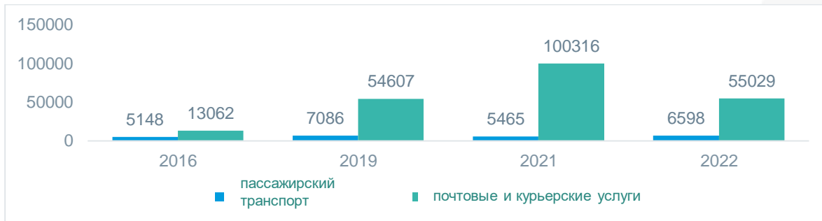
Рисунок 1. Количество зарегистрированных микропредпринимателей в транспортном секторе