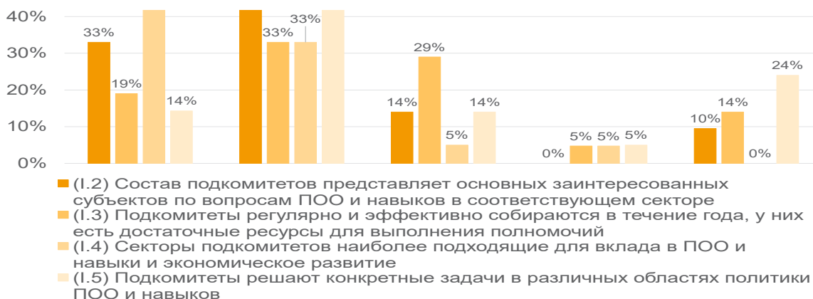
Рис. 1. Национальные показатели ПОО и навыков