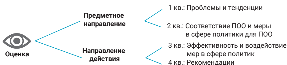
РИС. 2.3 НАПРАВЛЕНИЯ ВНЕШНЕЙ ОЦЕНКИ ПОЛИТИКИ В ОБЛАСТИ ПОО

Ответы на первые два вопроса описывают и анализируют состояние дел, как это представлено в национальных отчетах стран-партнеров. Третий вопрос предлагает провести внешнюю оценку мер в сфере политики с предметной точки зрения и с точки зрения реализации указанных мер, как это показано на рис. 2.3. Это включает оценку актуальности стратегических решений (решают ли они затронутые проблемы, связанные с профессиональными навыками?), их результативности и