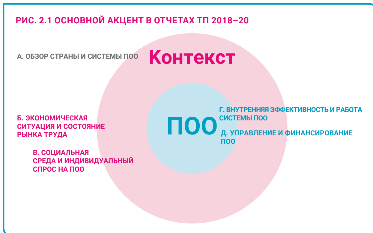
РИС. 2.1 ОСНОВНОЙ АКЦЕНТ В ОТЧЕТАХ ТП 2018–20

Блок А готовит почву для вопросов в блоках Б–Д путем сбора общей информации о каждой стране, организации национальной системы ПОО и концепции развития ПОО, а также основных данных о социально-экономической среде, в которой функционирует система ПОО.