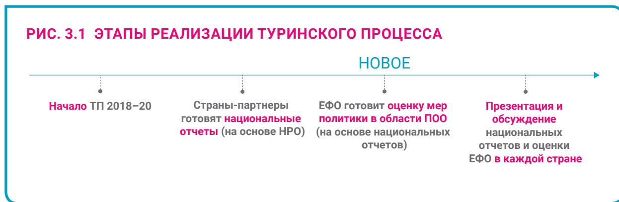
РИС. 3.1 ЭТАПЫ РЕАЛИЗАЦИИ ТУРИНСКОГО ПРОЦЕССА

Реализация Туринского процесса в каждой стране будет учитывать любые другие соответствующие процессы (реализуемые странами, ЕФО или ЕС либо другими донорскими или международными организациями), которые имеют аналогичные или схожие задачи и применяют анализ на основе фактических данных. ЕФО включит итоговые результаты этих процессов или отчетов в реализацию Туринского процесса, обеспечивая использование существующей информации и не допуская дублирования с другими схожими процессами. Также ЕФО проследит, чтобы при реализации Туринского процесса учитывалась корреляция с реализацией Рижских заключений (см. Раздел 3.3.1).